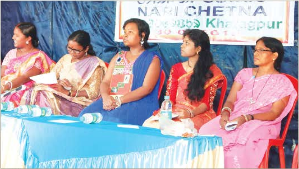
नारी चेतना कार्यक्रम में संताली लेखिकाएँ 30 जून 2015, खड़गपुर