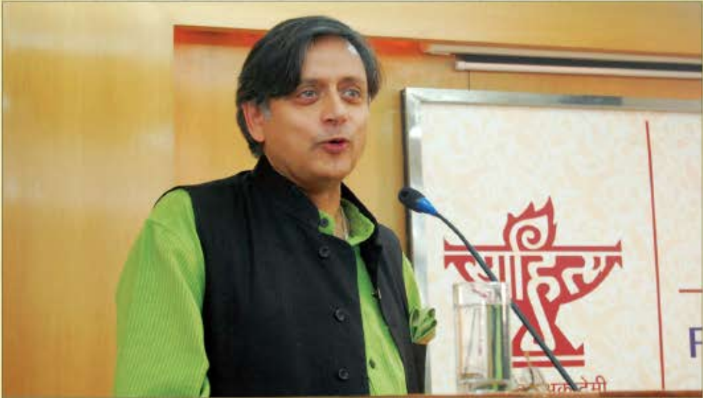
स्थापना दिवस व्याख्यान देते हुए प्रख्यात लेखक एवं माननीय संसद सदस्य डॉ. शशि थरूर 12 मार्च 2016, नई दिल्ली