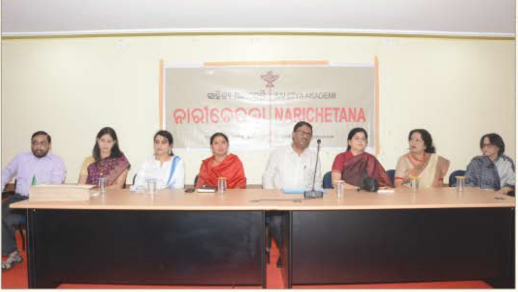
कार्यक्रम में ओड़िया लेखिकाएँ 17 अक्टूबर 2015, भुवनेश्वर