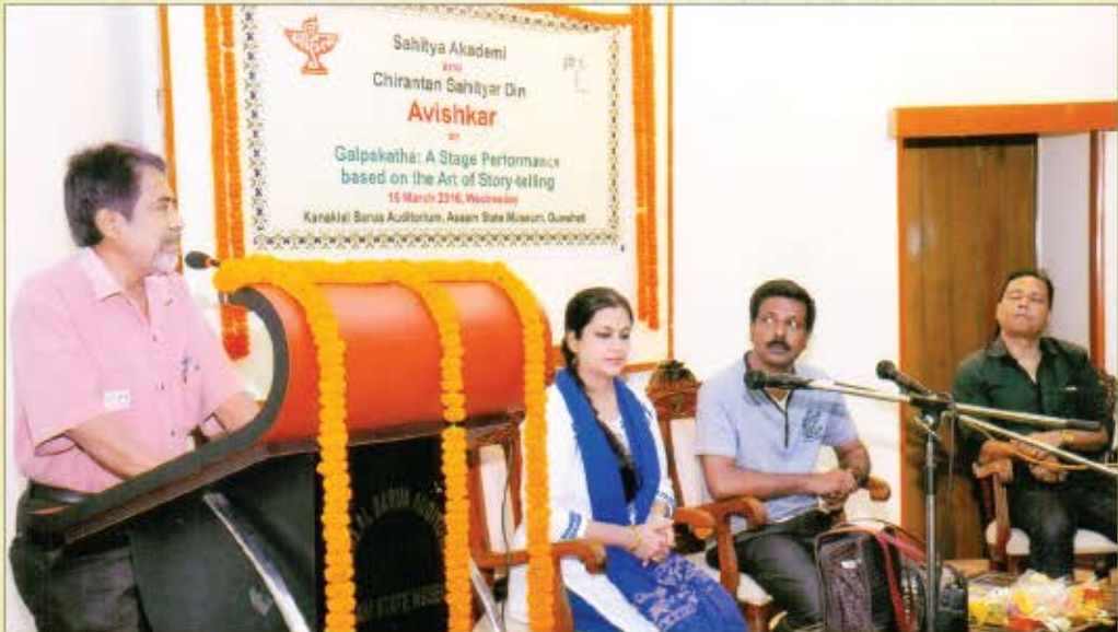
गल्पकथा : क्रिस्सागोई की कला पर आधारित कार्यक्रम 16 मार्च 2016, गुवाहाटी