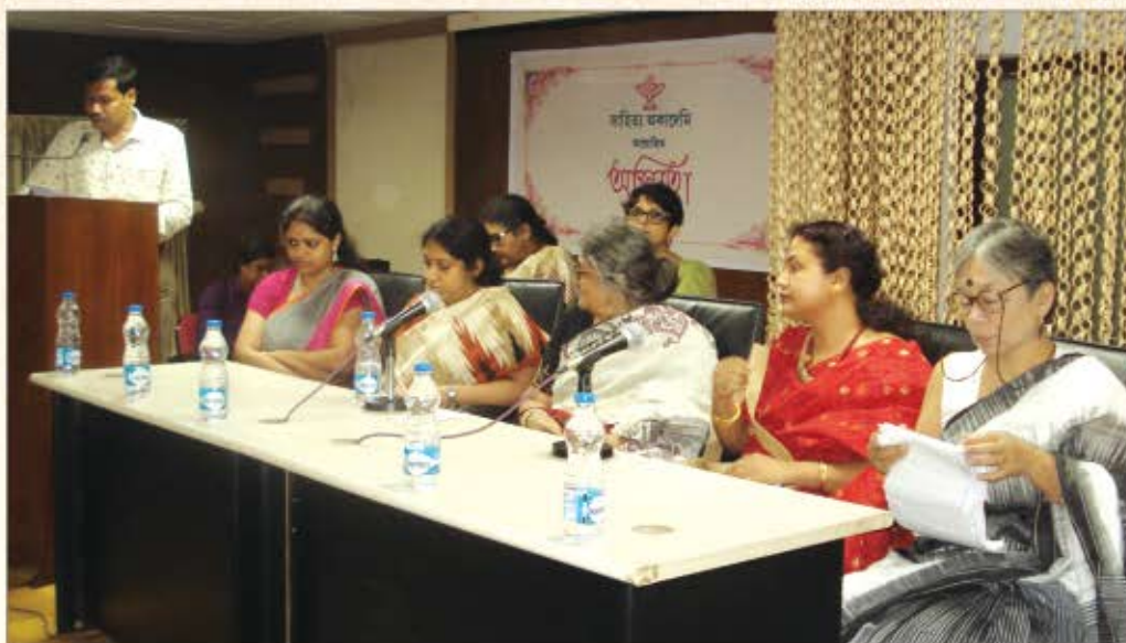
अस्मिता कार्यक्रम के प्रतिभागी 15 मार्च 2014, तिडखोड, असम