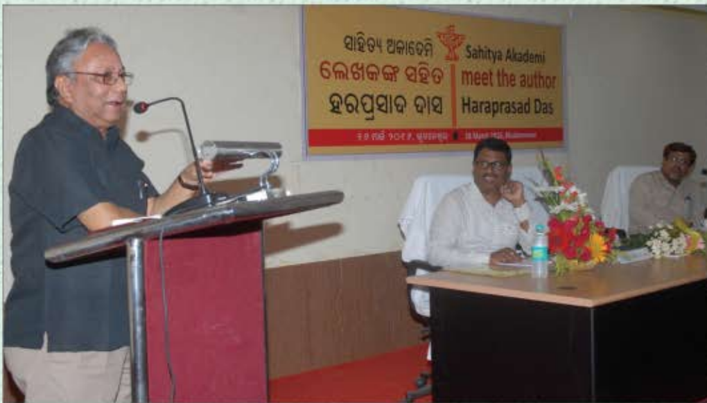
ओड़िया लेखक श्री हरप्रसाद दास 26 मार्च 2015, भुवनेश्वर