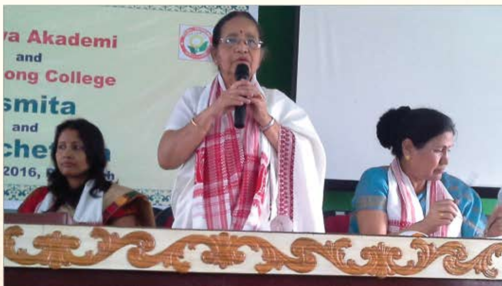
अस्मिता कार्यक्रम के प्रतिभागी 26 मार्च 2016, डिब्रूगढ़