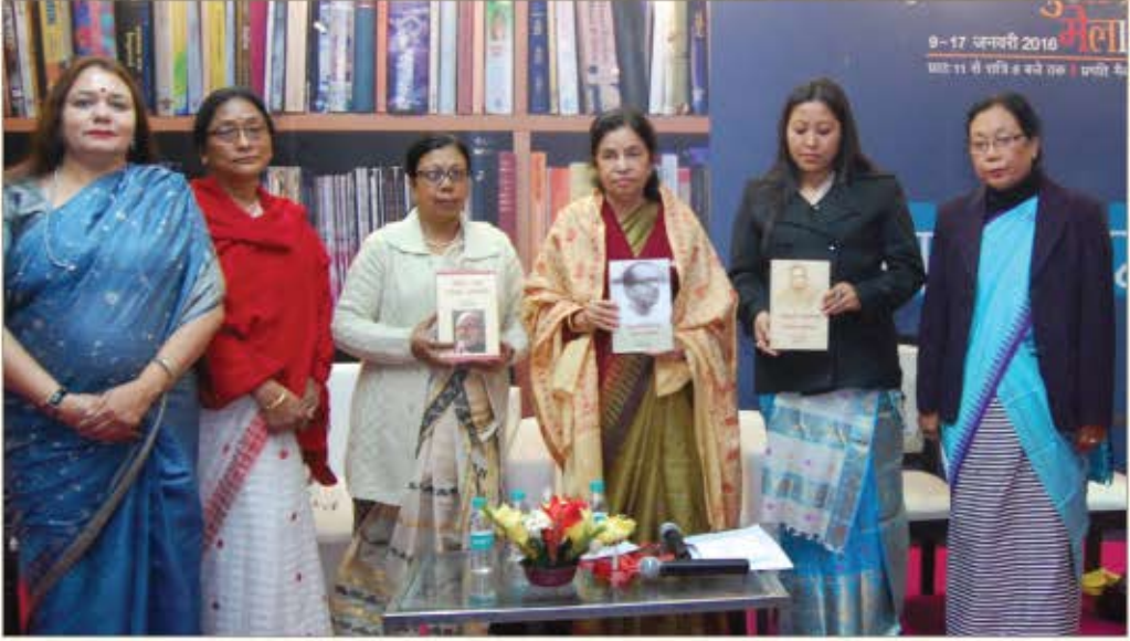
कार्यक्रम के प्रतिभागी 14 जनवरी 2016, नई दिल्ली