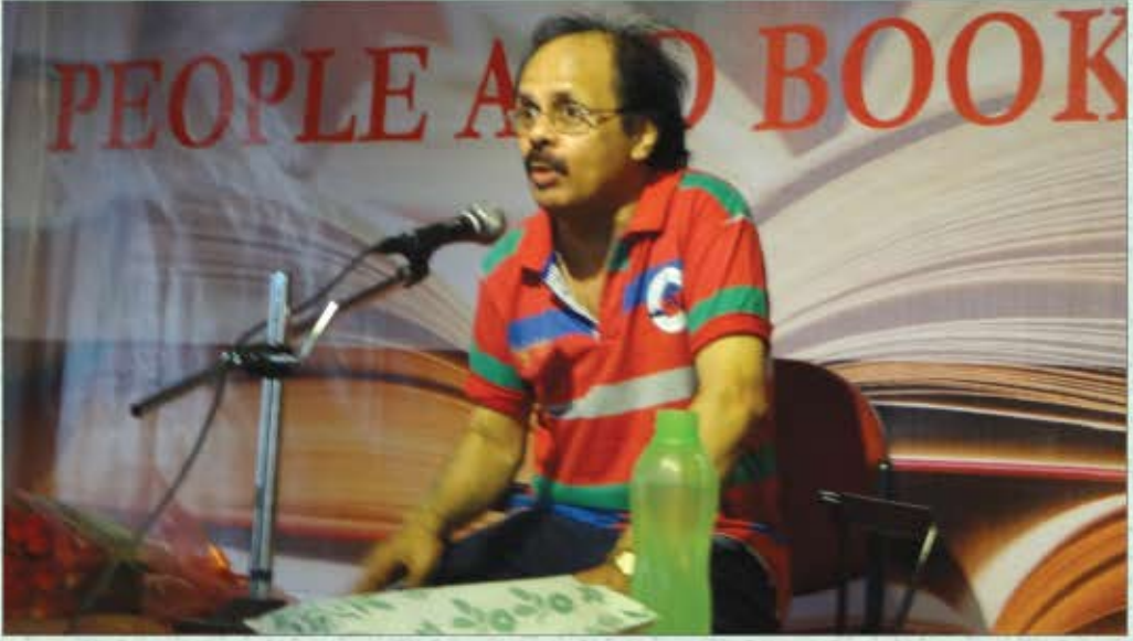
लोकप्रिय तमिळ अभिनेता, पटकथा लेखक एवं नाट्यकार श्री 'क्रेज़ी' मोहन 30 मई 2015, चेन्नै