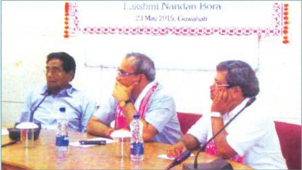
प्रख्यात असमिया लेखक श्री लक्ष्मी नंदन बोरा 23 मई 2015, गुवाहाटी